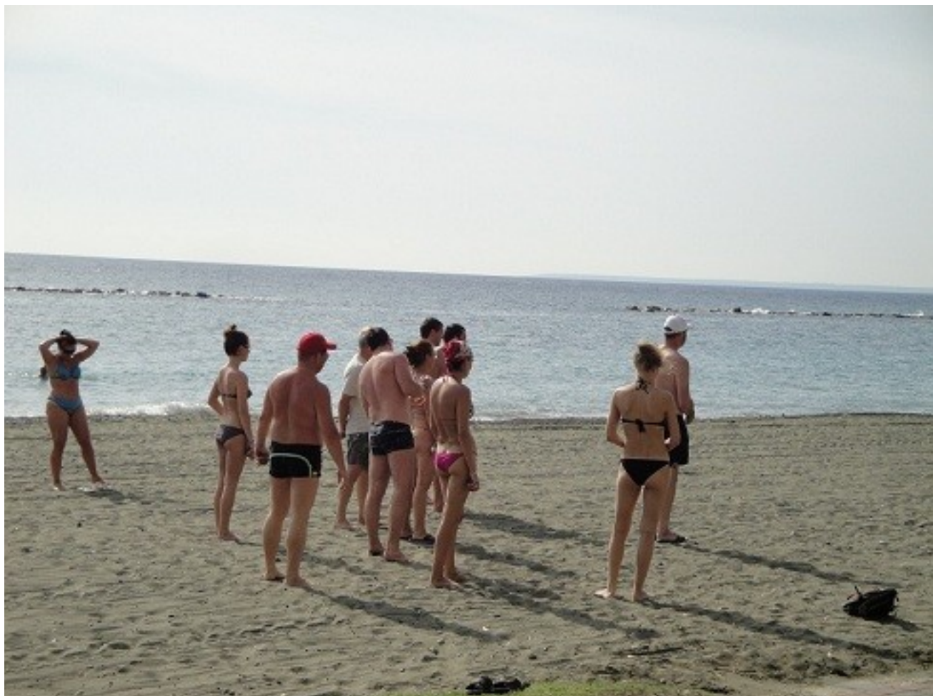
Берег в Протарии, солнечные пляжи. Именно здесь богиня любви и красоты Афродита